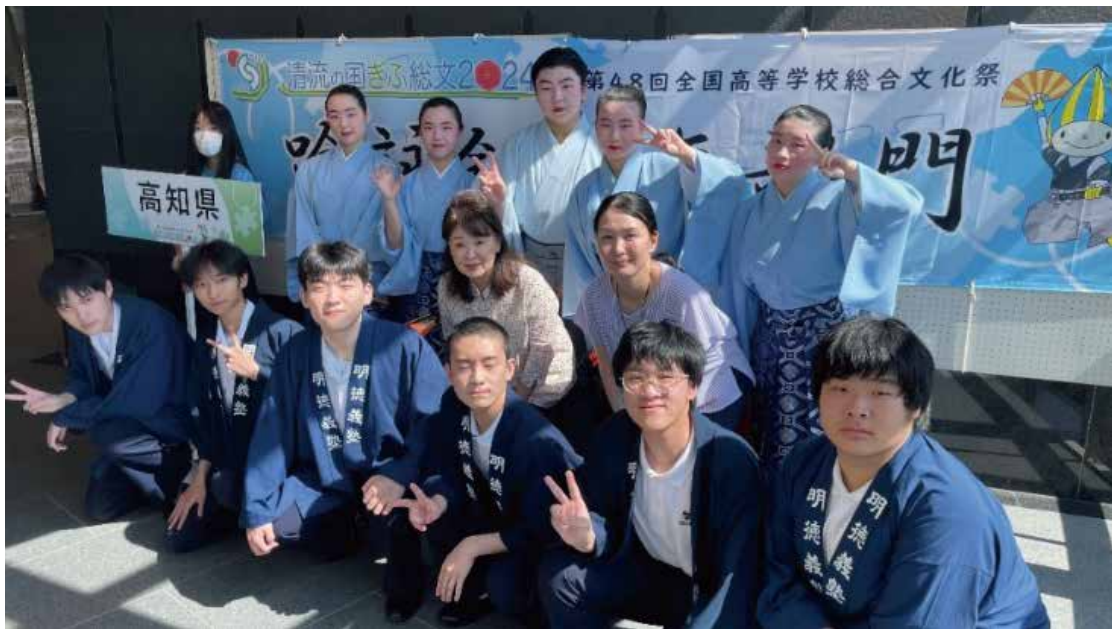
舞台演技が終わり、生徒と先生方との記念撮影