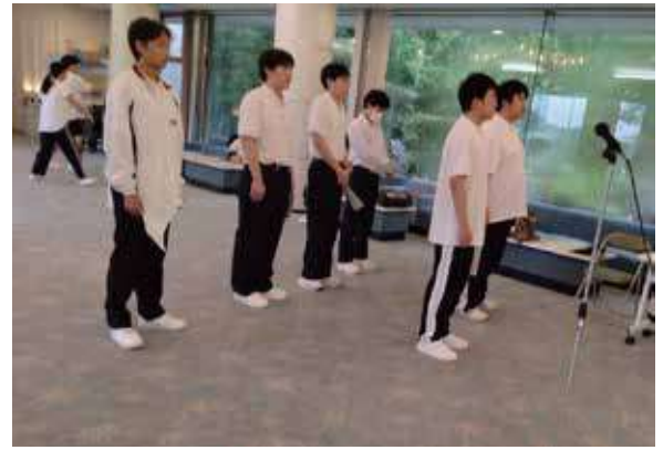
男子生徒は吟詠の練習