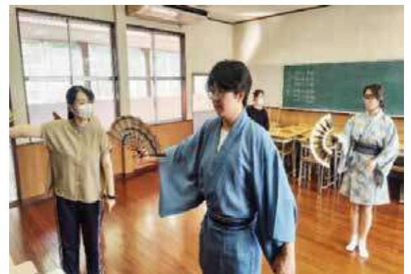
詩舞の稽古とリハーサル