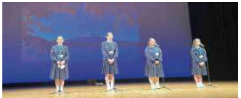
富士山を背景に、4人による吟詠