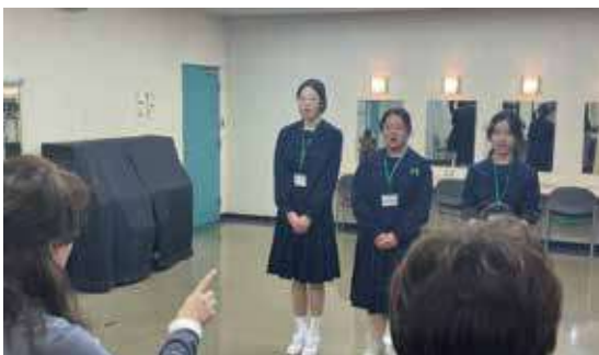
リハーサルでの吟詠稽古

高知県からは、明德義塾高等学校の和歌「晴れてよし」本居宣長と合吟「富士山」石川丈山であった。ロゴマークは、かがわ総文祭の吟詠・詩部門。