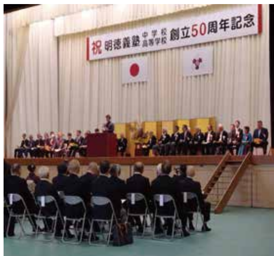
式典 生徒代表謝辞