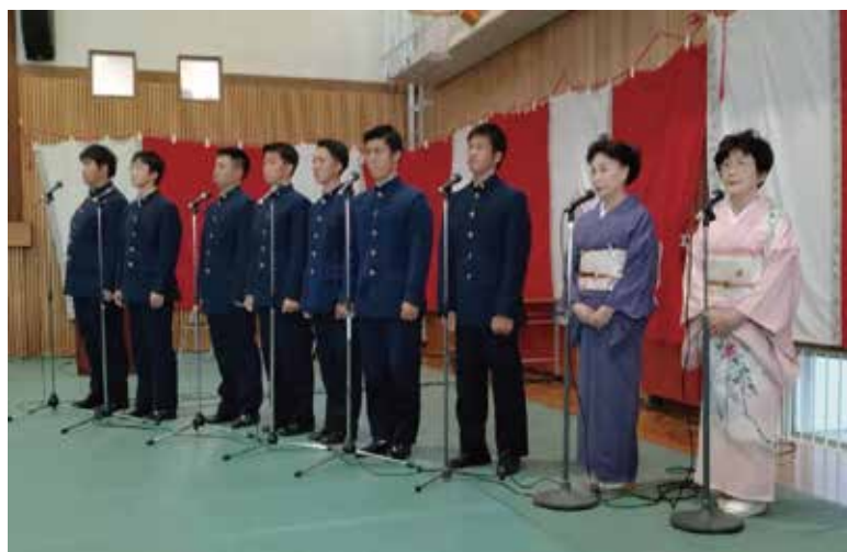
生徒合吟の先導者はマイクの前に立つ