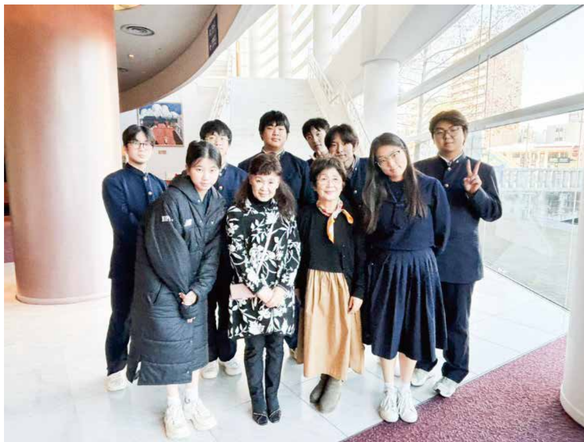
舞台が終わって安堵のチーズ