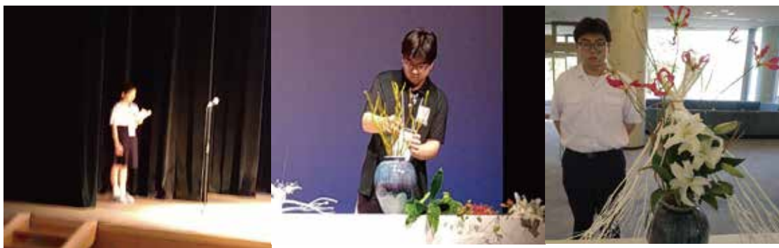
ナレーター : 黄昀曦 コウ インギ