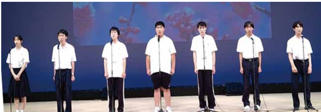
合吟 「江南の春」吟詠