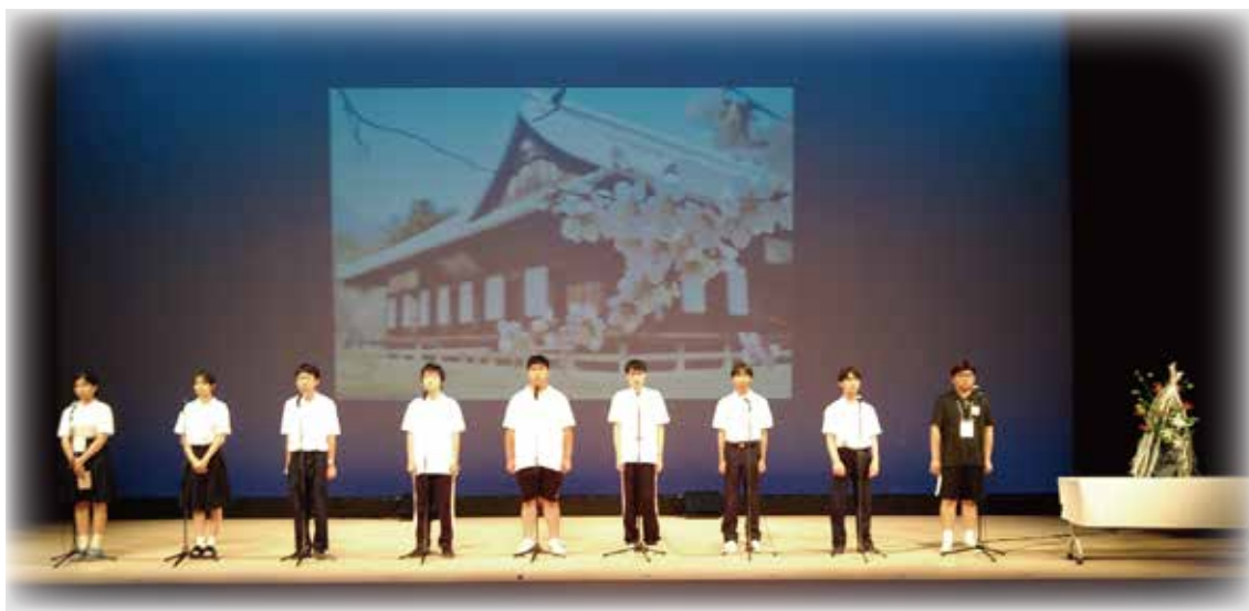
第47回全国高等学校総合文化祭 2023 かがしま総文 SSプラザせんだい 令和5年7月31日開催